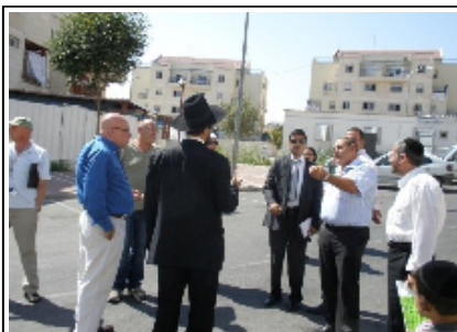
הסיור שנערך היום בבית שמש