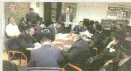
תקצו. עיריית בית שמש

מוסדות החינוך החרדיים בבית שמש מתרחבים והולכים מדי שנה בשנה, בסדר גודל של כ-10% יותר מבשנה שחלפה. בעוד ולפני כניסתו של גרינברג לתפקידו, אגף החינוך החרדי בעירייה הכיל עובר יחיד בלבד, עתה לאחר ארבע שנות עבודה, מספר העוברים עלה בו עשרת מונים והוא מתקרב ל-100 עוברים מהציבור החרדי הנותנים שירות לעשרות אלפי תלמידי המגזר החרדי.