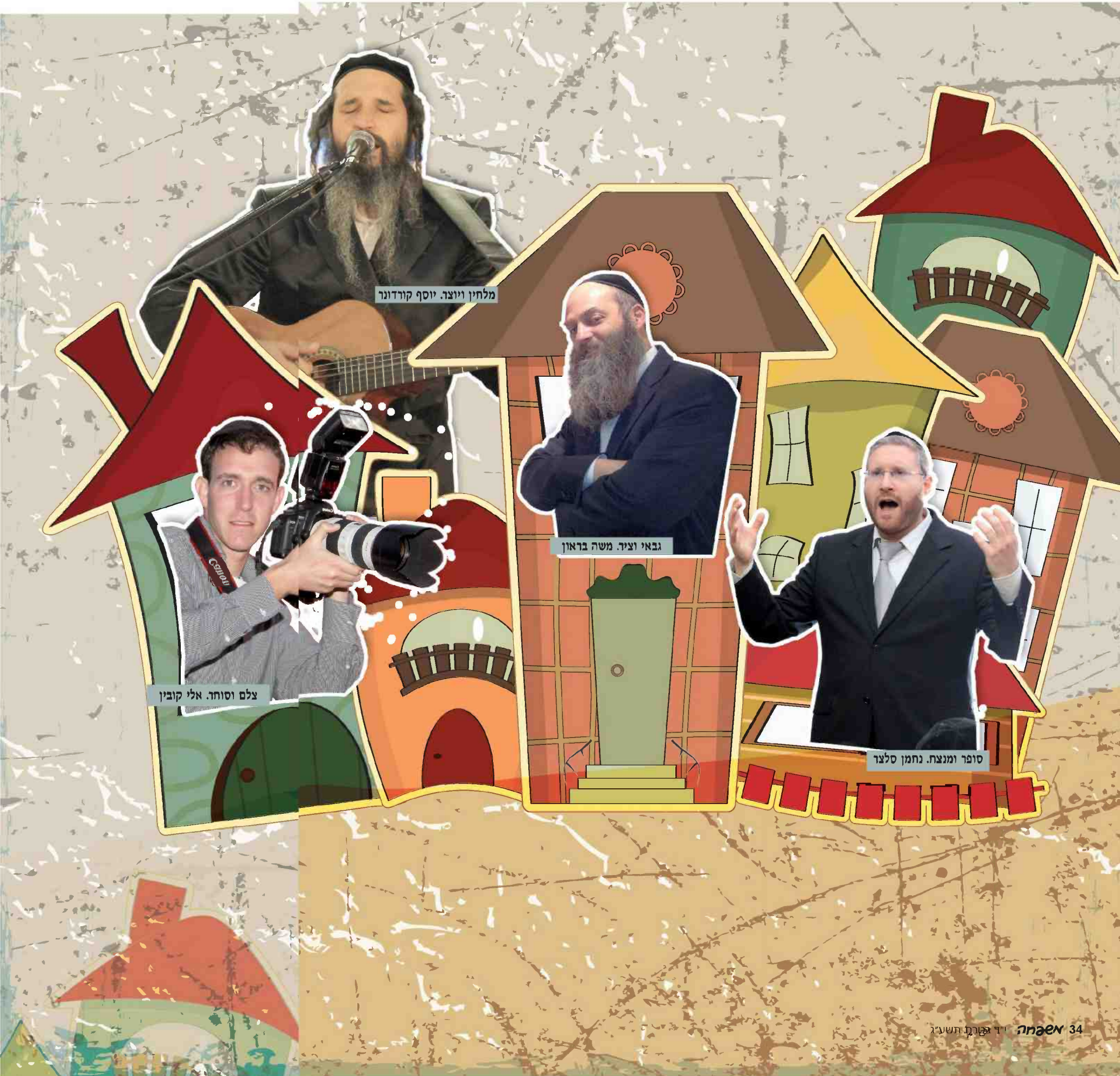
מלחין ויוצר. יוסף קורדונו