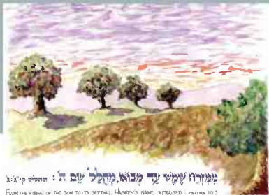
ממחזור 'קיש עד מבוא מקלל יום ה': החולם קיציצ From the cycle of the sun to the setting, Heaven's name is praise - פילמוס המרחב מאפשר יצירה. ציור: משה בראון