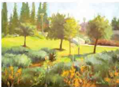
מקום למחשבה. ציור: דבקה פיק