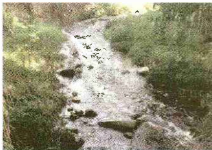
בקרוב מוקד חירות. נחל שורק

"כשאתה רואה איזה אזור נפלא יש כאן בכניסה לבית שמש, יער איקליפטוסים עם נחל טבעי, קשה להבין מה יש לתושבי בית שמש לחפש בצפון. את הנחלים שהם מחפשים שם הם יכולים למצוא ליד הבית. אומנם צריך לשרג את המקום ולהופכו לנגיש ובטיחותי, אבל בהחלט מדובר במקום שיכול להקפיץ את בית שמש קדימה ולהפוך אותה למוקד תיירותי", אומר גרינברג.