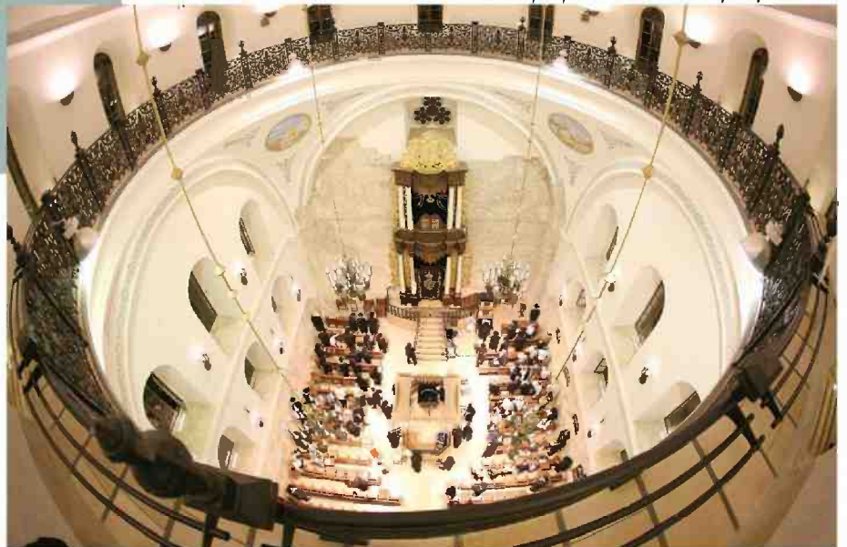
"תיעדתי מאה בתי כנסת. התמונות במחסי".