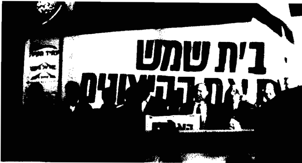
ראשי « אקטואליה » חשיפה • מסמכים מוכיחים: החרדים ממנים את החילונים בבית שמש